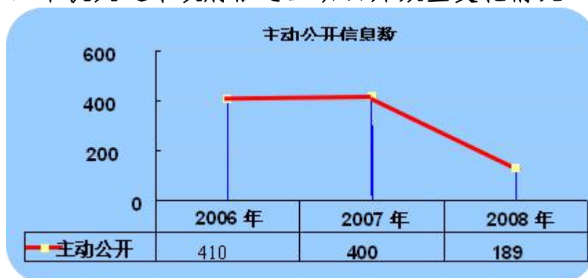
附图一：本机关近年政府信息主动公开数量变化情况